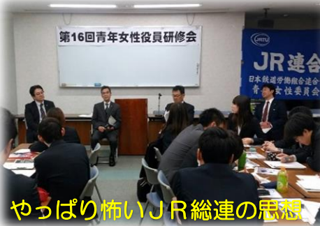
やっぱり怖いJR総連の思想