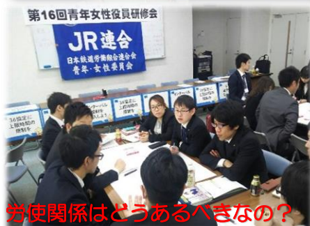
労使関係はどうあるべきなの?