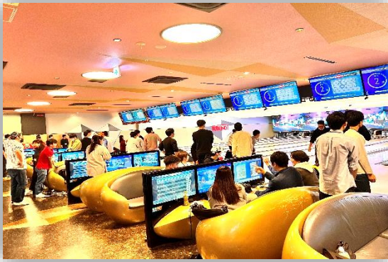
激戦ボウリング大会！