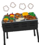
食材追加分をゲット！！