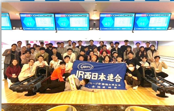
参加者全員で集合写真！！

今後もJR西日本グループの仲間意識を醸成するため、様々なレクリエーションを計画していきます！