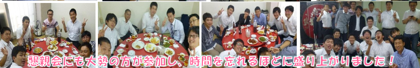
懇親会にも大勢の方が参加し、時間を忘れるほどに盛り上がりました！