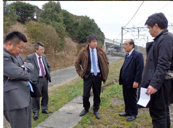
▲ 太宰府信号場への新駅設置は土地区画整理事業が進められているエリアであり、村山市議としても悲願ということである。