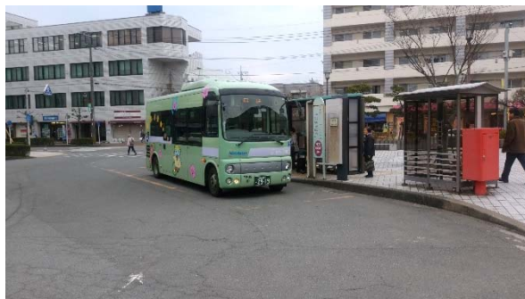
▲ コミュニティバス「まほろば号」は地域の重要な交通手段として、地元から指示されている。